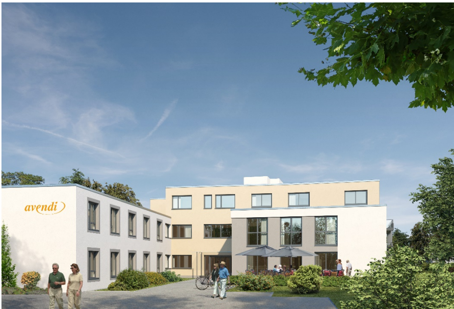
Visualisierung Pflege AM STEINSBERG, Eingangsbereich mit Cafeteria rechts