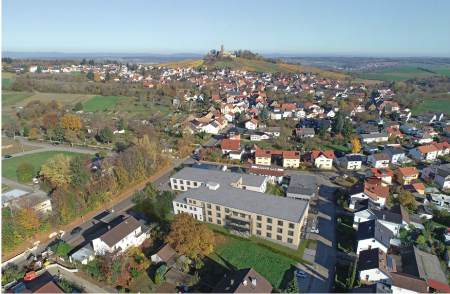
Visualisierung Pflege AM STEINSBERG in Sinsheim-Weiler, Luftbildanimation